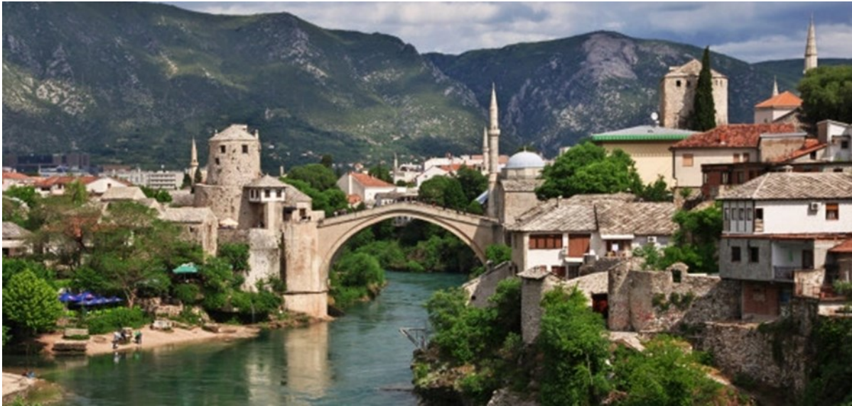
Ponte Vecchio di Mostar

Inoltre, vi sono altre aree candidate ad entrare in tale lista: la stessa città di Sarajevo (simbolo di multiculturalità), Jajce, Pocitelj, Stolac, Blagaj, la cava di Vjetrenica.