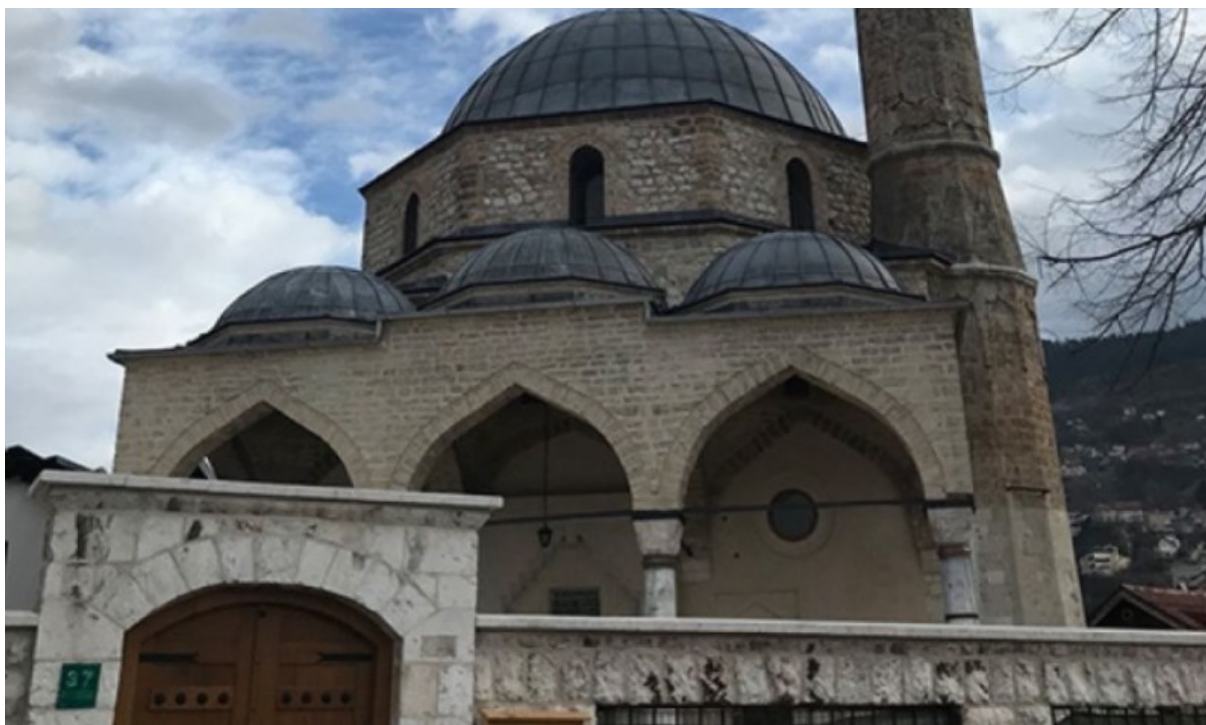
Moschea di Baščaršija Sarajevo

Un esempio di ciò è la restaurazione e la conservazione dei muri esterni, delle scritte calligrafiche e dei mobili della moschea di Baščaršija Sarajevo ultimata il 21 marzo 2020. Progetto del valore di 500 mila euro realizzato in collaborazione con partners turchi.