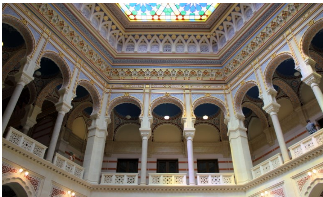
Vijećnica or City Hall Interior, Former National University Library, Sarajevo old town, Bosnia and Herzegovina

Per quanto riguarda l'industria manifatturiera, l'aumento è stato del 14,2%, raggiungendo percentuali anche maggiori nel settore della produzione dei macchinari (+26,8), dell'arredamento (+22,3%), dei metalli (+20,1%) e del tessile (+19%), tutti settori di interesse per l'Italia sia da un punto di vista commerciale sia di investimento. Anche nel settore energetico si è registrata una crescita della produzione del +14,4%. Viceversa, nel settore minerario si è registrato, in controtendenza, un calo del 4,3% della produzione. Si tratta di primi segnali incoraggianti, la cui solidità andrà tuttavia testata alla luce del fragile contesto pandemico e dell'andamento degli scambi con i mercati europei.